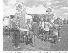
来場者に呼びかける