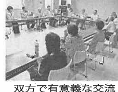
双方で有意義な交流

【平成29年5月23日~29年10月30日まで】 皆様のご協力、ご支援ありがとうございました。