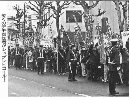
多くのデモ参加者がシニプレヒコル!

3月8日(日)、第12回目となる抗議デモ及び集会が開催されました。当日は「観察処分の期間が3年間延長された」と(第5回目)の報告や、地下鉄サリン事件より20年の節目に、これまでオウムが引き起こした数多くの事件の風化の防止オウム(アレフ)に対し早期解散を求めることを目的に抗議デモ行進が行われ、約200名の人が参加しました。